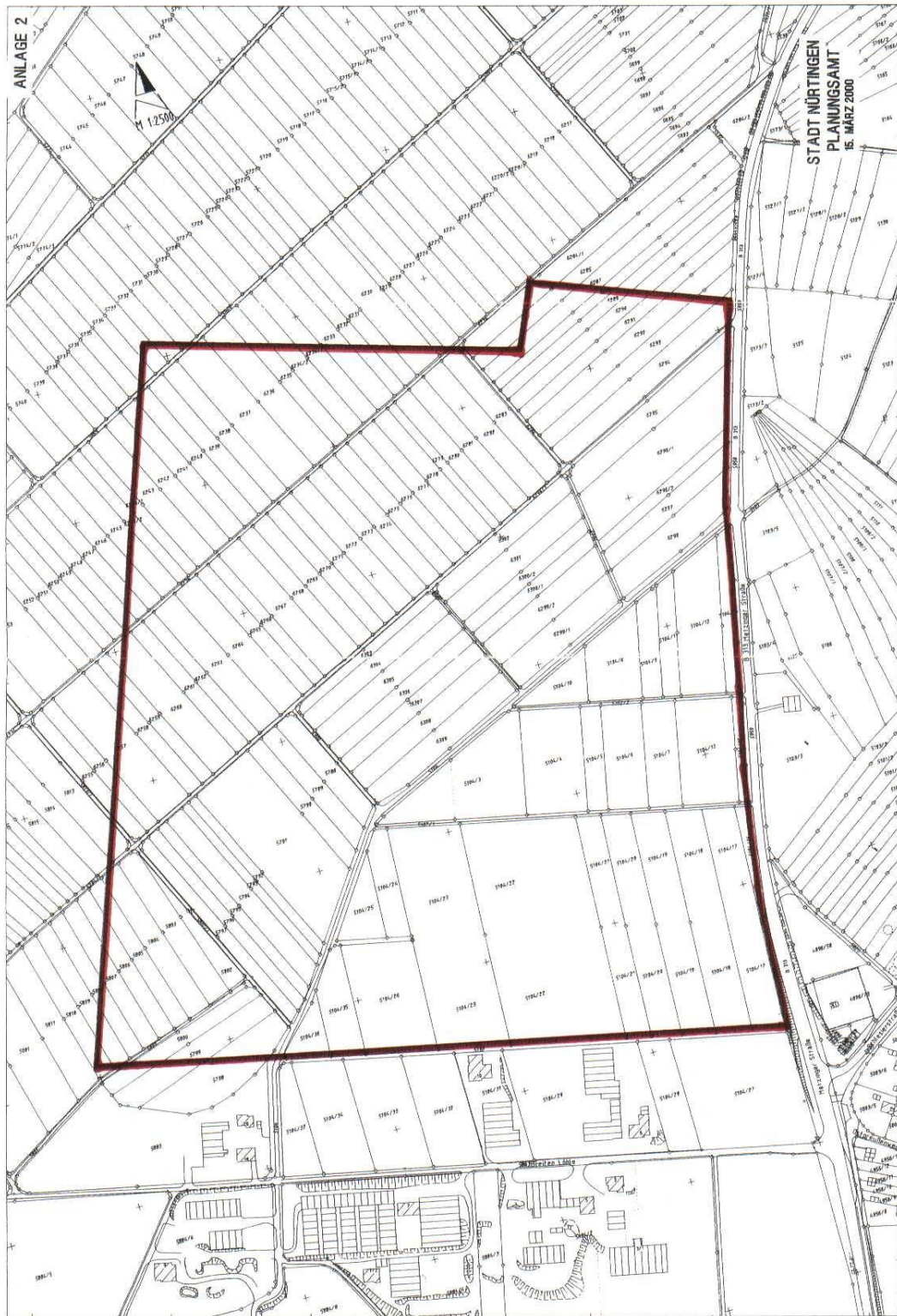
Gebiet Großer Forst